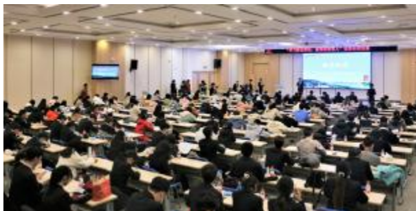
图 3 会计学专业学生参加 CGMA 商业精英国际挑战赛

6. 外部评价满意度高。学院定期对毕业生进行跟踪调查,征求毕业生和用人单位意见,分析就业市场需求状况,用人单位普遍评价我院毕业生业务能力强、应用性强、诚实守信以及敬业精神好,就业竞争力及社会声誉不断提高。根据艾瑞深中国校友会网排名,学院会计学专业为 3 星专业,在全国财经类院校中具有一定的影响力。