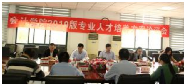
图2 会计学专业人才培养方案论证会

2. 打造专兼结合、能力互补的高素质教学团队。以教学内容改革和教学模式创新为手段,构建发展目标明确、梯队结构合理、具有良好合作精神和发展潜力的教学团队;依托学校重点发展的学科研究领域和学科平台,积极引进海外高水平人才及外籍教师,不断提升团队的学术水平、专业素养和国际化素质。